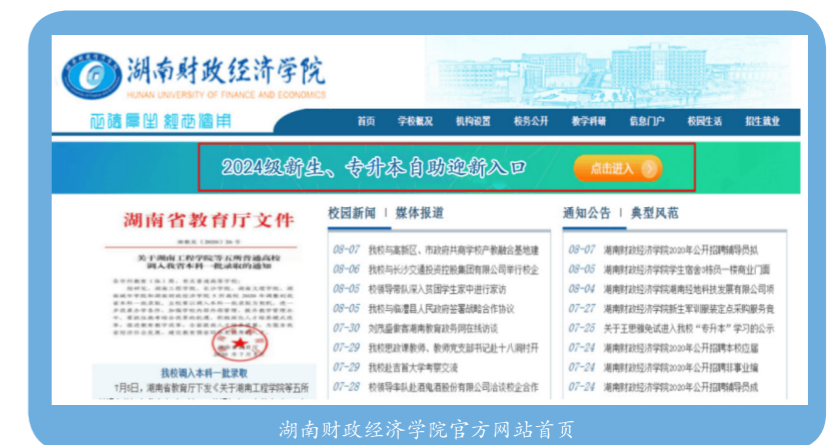
湖南财政经济学院官方网站首页

1. 电脑访问：新生或家长在PC端的浏览器地址栏中输入湖南财政经济学院官网地址（ https://www.hufe.edu.cn/home ），在学校官网导航栏目下方自助迎新入口图片“点击进入”自主迎新PC端页面；