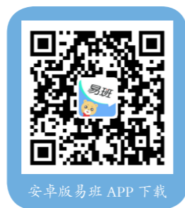
安卓版易班 APP 下载

2. 完成易班注册后，在易班优课开展《新生入学教育》课程学习（课群邀请码：JFCFBEGX），并于9月1日前完成相关考试。具体的教程请关注微信公众号“湖南财政经济学院学工在线”（左上方二维码）搜索关键词“易班新生入学指南”观看教程，请各位新生按时完成入学教育。