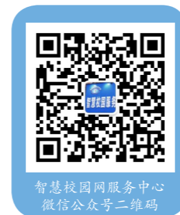
智慧校园网服务中心 微信公众号二维码