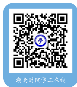
湖南财院学工在线

1. 新生入学前需完成易班客户端的安装：IOS系统手机可直接进入app store搜索“易班”进行下载安装；安卓系统手机，使用扫码下载（右下方二维码）；装好程序后，请阅读易班网和“湖南财政经济学院学工在线”微信公众号里面的《易班2024级新生注册和使用指南》，完成注册；