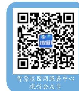
智慧校园网服务中心 微信公众号

服务时间：9:00-18:00；服务电话：0731-82208259、4009620731。